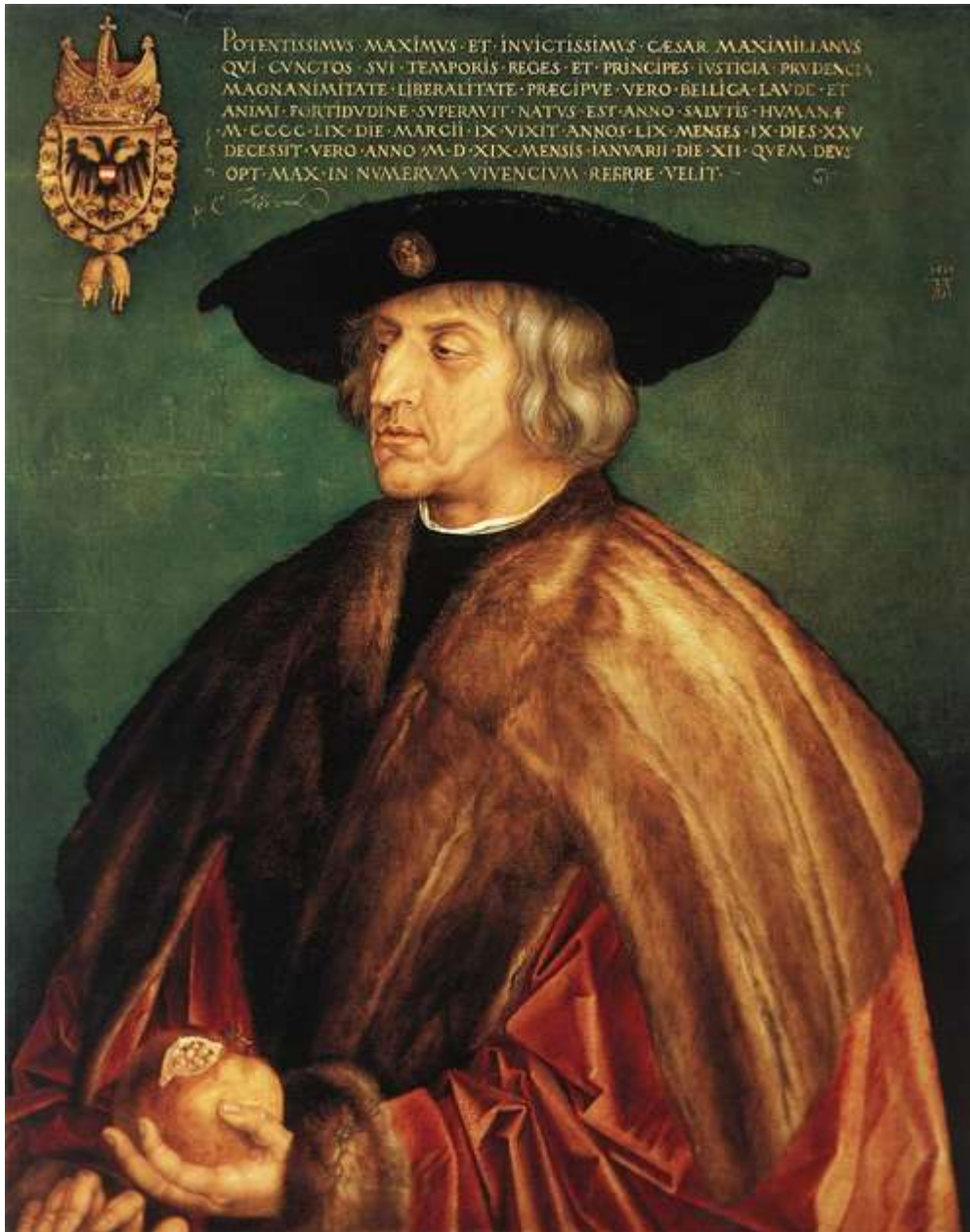
De Oostenrijker die in 1488 de marine oprichtte: Maximiliaan van Oostenrijk, geschilderd door Albrecht Durer in 1519.

8 januari 1488 wordt gezien als stichtingsdatum van de Nederlandse marine, omdat Maximiliaan van Oostenrijk die dag de Ordonnantie op de Admiraliteit uitvaardigde. Hiermee werd voor het eerst een permanente marine organisatie voor de Nederlanden opgericht. 8 januari kan daarom, vrij naar de verjaardag van het Korps Mariniers, gezien worden als de 'Vlootverjaardag'.