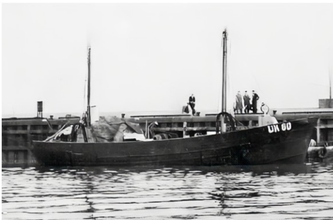
Na de ramp .