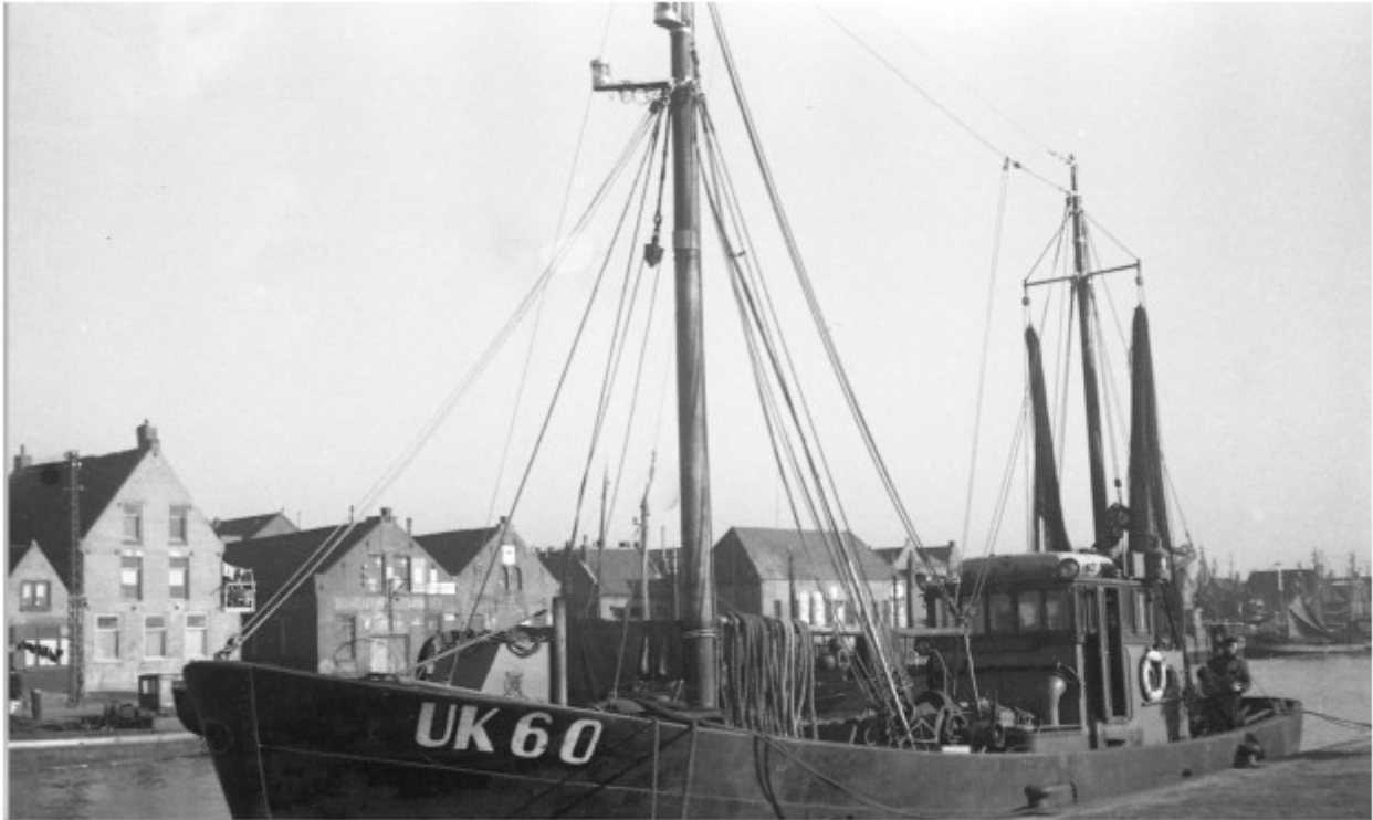
Neeltje (UK 60)

zeebodem rijk was aan leven. Mijn vader en zijn bemanning waren vastberaden om een goede vangst binnen te halen, met hun ogen gericht op de uitgestrekte horizon.