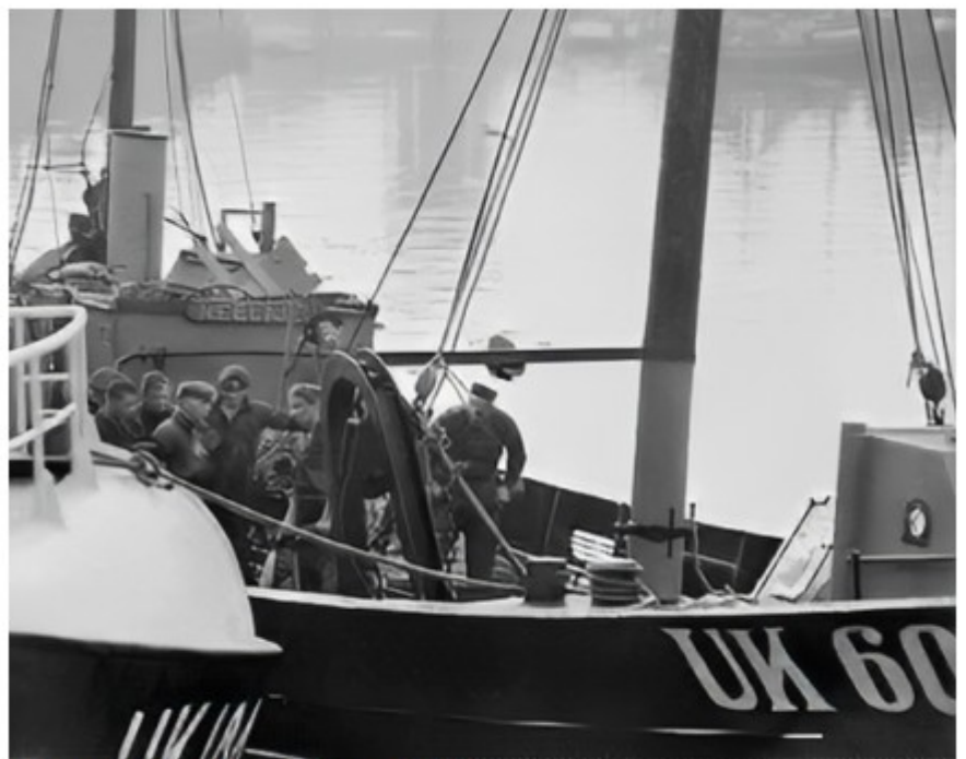
Zonder stuurhuis, zonder schipper...

De woorden van mijn ome Piet raakten me diep, doordrenkt van emotie terwijl hij zijn gedachten deelde. Machteloosheid was alles wat hij voelde, met het besef dat mijn vader hoogstwaarschijnlijk verdronken was en dat hetzelfde lot hem te wachten stond. Zijn gedachten gingen uit naar zijn ouders, zijn meisje, en naar mijn moeder, die hoogzwanger was en binnenkort mij zou baren, beladen met dit immense verdriet. Deze gedachten brachten zelfs na al die jaren een golf van emotie teweeg.