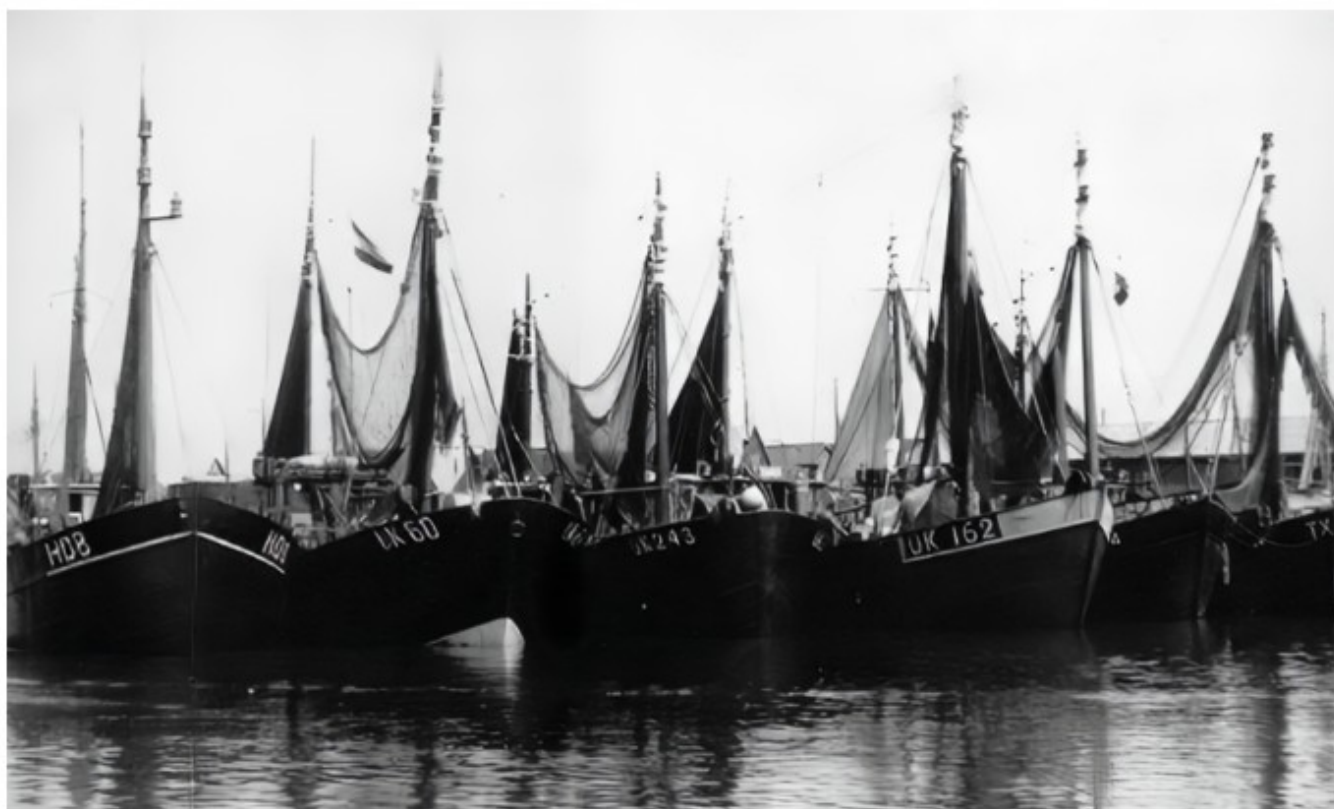
In de haven.

Gelukkig was de UK 60 een zeewaardig schip en zegt hiermee dat het schip een goede stabiliteit had.