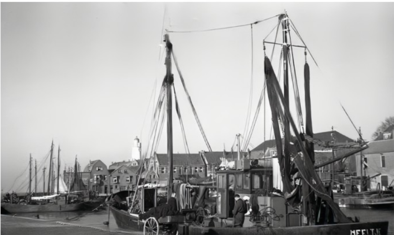
In betere tijden

Na deze noodreparatie die redelijk was gelukt, kreeg de bemanning opdracht van mijn vader droge kleren aan te trekken in het vooronder.